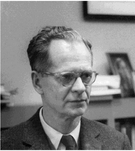
Berrhus Frederic Skinner (20/03/1904 – 18/08/1990)